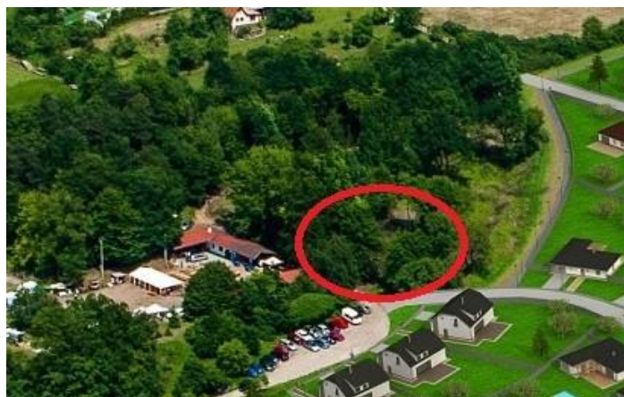
Lokalita - obec Železné - Záhomí

Cílový stav zajistí uvolnění kapacit MŠ v Tišnově pro potřebu města a zajistí umístění dětí ze zúčastněných obcí v novém předškolním zařízení. Nejbližší předškolní zařízení je ve městě Tišnově nebo v Lomnici u Tišnova. Tato zařízení již delší dobu vykazují nedostatečnou kapacitu v umísťování dětí svých občanů. V rámci výstavby školky vzniknou i prostory pro volnočasové aktivity dětí z přilehlého regionu.